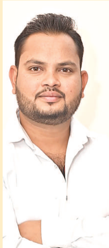
नागवानी, एवं अन्य लोगों ने बधाई दी है।