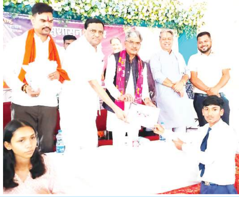
योजनाओं से लोगों के जीवन में आए सकारात्मक बदलावों पर भी चर्चा

शिविर में बड़ी संख्या में पहुंचे नागरिकों से आत्मीय संवाद कर उनकी समस्याओं, मांगों एवं अपेक्षाओं को जाना गया। ग्रामीण एवं शहरी क्षेत्रों से आए लोगों ने विभिन्न विभागों से संबंधित समस्याएं अधिकारियों के समक्ष रखीं। इस दौरान प्रदेश एवं केंद्र की डबल इंजन भाजपा सरकार की जनकल्याणकारी