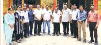
शास उच्च माध्य विद्यालय देवरी में शाला प्राबंधन समिति का गठन