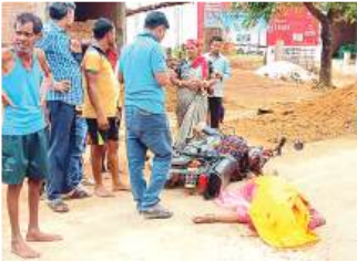
के लिए अस्ताल भेजा गया है। घटना की सूचना मिलते ही गौरियाबंद कोतवाली पुलिस मौके पर पहुंची और शव को कब्जे में लेकर पंचनामा कार्रवाई शुरू की। पुलिस दुरंतना के कार्यों की जांच कर रही है तथा आगे की वैधानिक