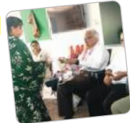
नगरिय विकास विभाग के कार्य निरीक्षण, महिलाओं को आबंटित भूखाने पर दिवा जलाते