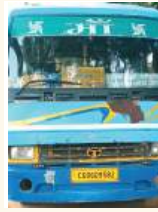
संकेतक, नियमित पुलिस निगरानी तथा अन्य सड़क सुरक्षा उपाय लागू करने की मांग की है। उनका कहना है कि यदि जल्द प्रभावी कदम नहीं उठाए गए तो भविष्य में और भी बड़े हादसे हो सकते हैं। फिलहाल पुलिस सभी मामलों की जांच में जुटी हुई है।

दो दिन में दूसरी मौत, ग्रामीणों में भारी नाराजगी